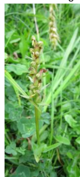
→ noch 2 Orchideen: Hohlzunge, braunrote Stendelwurz