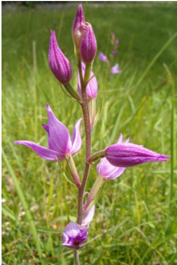
Orchideen: Rotes Waldvögelein