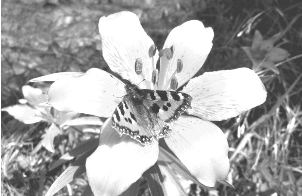
am Felsenweg 6.7.2016

Samstag, 11. März 2017, 13.30 Uhr im Zentrum Monséjour, Küsnacht